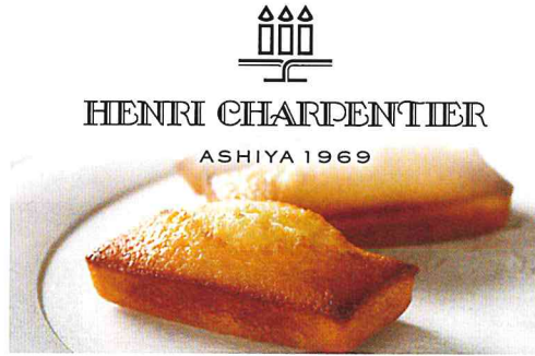
販売個数 世界一のギネス世界記録®を7度も達成した同社のフィナンシェ